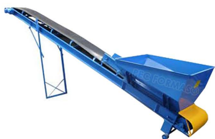
ESTEIRA TRANSPORTADORA DE 4,5M EST4500 ESTEIRA TRANSPORTADORA DE 6M EST6000