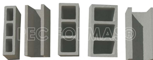
Fabricamos fôrmas de bloco para todos os tipos de máquinas