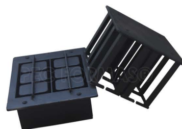
Fabricamos fôrmas de bloco para todos os tipos de máquinas