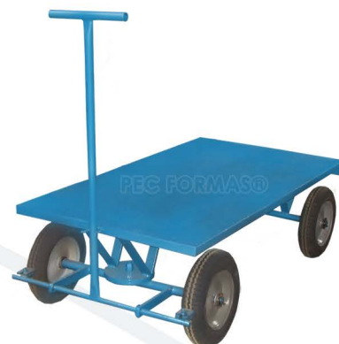
CARRO PLATAFORMA CP-600A

Rua Lucília Peres, 98 - Jd. Esther Yolanda CEP 05374-150 - São Paulo/SP Brasil