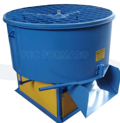
MISTURADOR DE EIXO VERTICAL COM MOTOREDUTOR MST-500 | MST-750