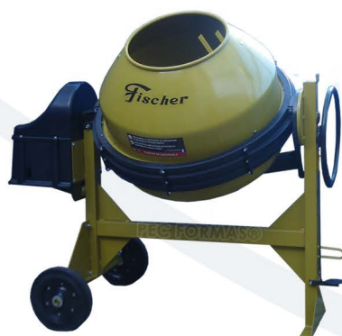
BETONEIRA FISCHER 400 LITROS COM PROTETOR CREMALHEIRA MONOFÁSICO BTF-400CMM TRIFÁSICO BTF-400CMT