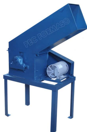
TRITURADOR DE BLOCOS TRITBL-SM